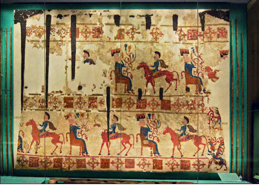
Resim 2: Dünyanın En Eski Halılarından Biri Olan Pazırık Keçe Halısı

Tepme keçe sanatı, Göktürkler tarafından da kullanılmış ve bu sanata önem verilmiştir. Bu önem Kağanların tahta çıkış törenlerinde tepme keçe yaygılar (örtüler) kullanmalarından da anlaşılmaktadır. Kağanın kendisine tabi beyler tarafından bir keçe üzerinde havaya kaldırılması ve daha sonra güneşin döndüğü yönde, dokuz kez otağın etrafında döndürülmesi geleneği bir ritüel olarak kullanılmaktaydı. Tüm bu tarihi bilgiler, tepme keçeden yapılmış yaygıların, ev eşyası olarak kullanılmalarının yanı sıra aynı zamanda hukuk ve devlet sembolü olduğunu da göstermektedir. (Ergenekon, 1999: 18)