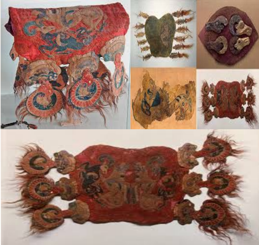
Resim 1: Ural-Altay Pazırık Kurganından Örnekler

günlük hayatta kullandıkları çeşitli eşyaları üretirken keçe malzemesi kullanmışlardır. Bu ürünleri üretebilmek için yetiştirdikleri hayvanların yünlerinden yararlanmışlar, ürünlerin yapımında kendi buldukları geleneksel yöntemleri kullanmışlardır. El sanatı ürünü olan keçe ile çadır, yaygı, giysi, ev eşyası, eyer örtüsü, halı, kilim gibi ürünleri kendi geleneksel yöntemleriyle yapmışlardır. Bu örneklerdeki tepme keçeler desenlenirken applike tekniği kullanılmıştır. Türk el Sanatlarının başlıca örneklerinin verildiği alan olması nedeniyle Pazırık Kurganı, oldukça önemli bir yere sahiptir. Pazırık Kurganında Türklerin ileriki çağlarda kaftan olaraklandırırdıkları giysinin en ilkel şekli bulunmaktadır. Pazırık Kurganlarında ele geçirilen keçe çoraplar, çizmeler, taraklar, gözgüler (aynalar), dönemin Türk yaşam biçimi hakkında bilgi vermektedir. Pazırıkta bulunan keçe ürünler, göçebe Türklere ait kültür öğeleridir (Ergenekon, 1999:5-23).